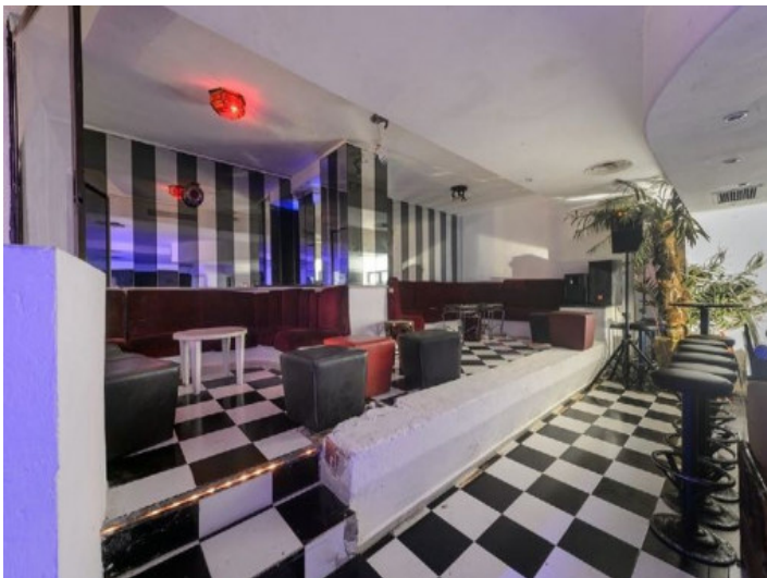
Einer von 3 Bartresen