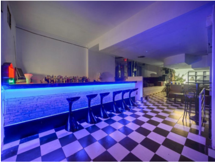
Einer von 3 Bartresen