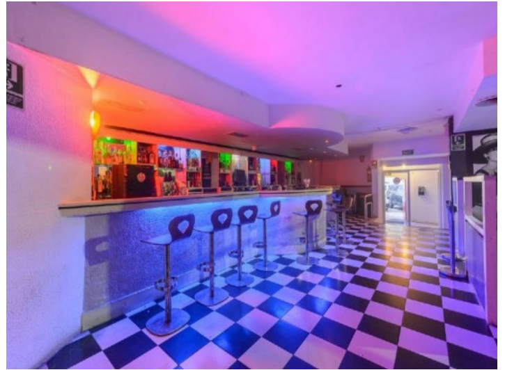
Einer von 3 Bartresen