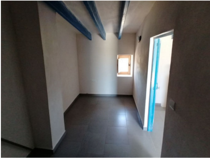
Charmante, blaue Holzdeckenbalken