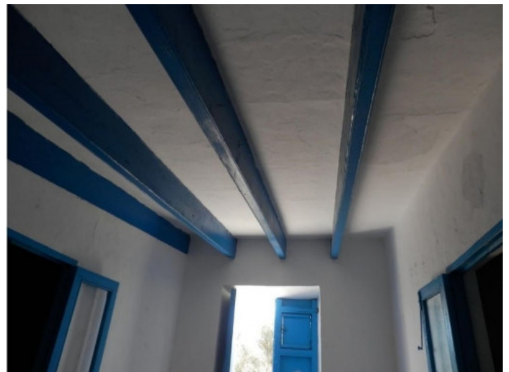
Charmante, blaue Holzdeckenbalken

Alle Angaben nach bestem Wissen. Irrtum und Zwischenverkauf vorbehalten. Dieses Exposé ist eine Vorinformation, als Rechtsgrundlage gilt allein der notariell abgeschlossene Kaufvertrag.