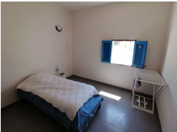
Schlafzimmer der Finca